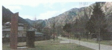
A la taula dels gegants