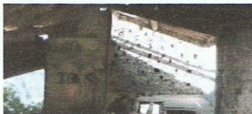
Un SOS pel colomer de Cotxa