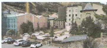
El Museu Nacional: compte enrere