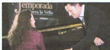
El tenor Piotr Beczala obre el cartell amb àries de Verdi, Puccini i Bizet